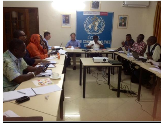
Réunion de coordination du staff de l'OMS sur la riposte à l'épidémie de maladie à virus Ebola