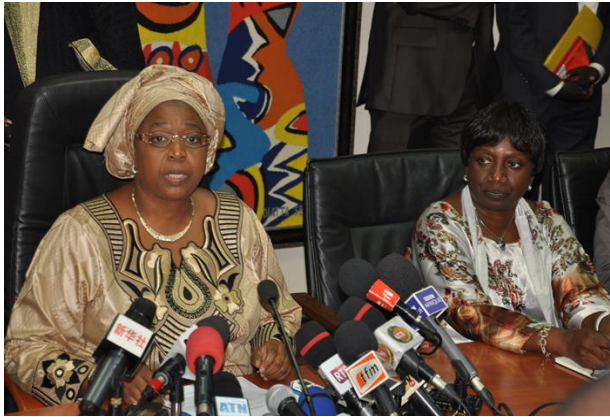
Point de Presse animé par le Ministre de la Santé et de l'Action Sociale et le Représentant résident de l'OMS