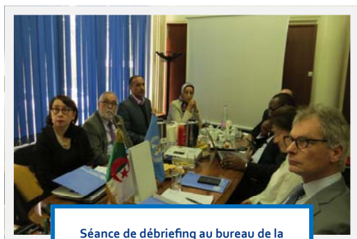
Séance de débriefing au bureau de la Représentation OMS

Une analyse situationnelle préliminaire a été présentée, lors d'une réunion de restitution tenue, le 26 février 2015, au siège du Ministère de la Santé. Le rapport préliminaire présenté par les membres de la mission, a relevé des efforts remarquables consentis par l'Etat dans la prise en charge et des traitements prodigués aux malades dans les centres Anti-Cancer (CAC) Des recommandations ont été formulées pour une meilleure utilisation de l'énergie nucléaire en conformité avec les normes préconisées par l'OMS et l'AIEA dans le domaine de la santé.