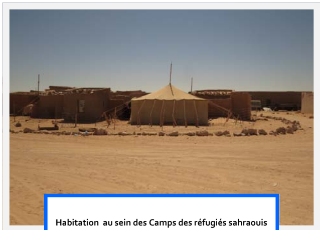
Habitation au sein des Camps des réfugiés sahraouis à Tindouf