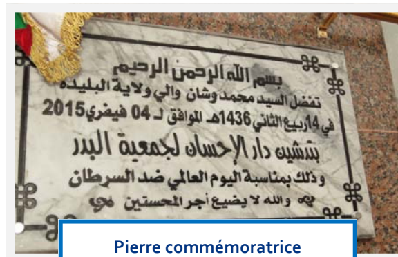
Pierre commémorative de DAR EL IHSAN

Pour sa part, le Pr Zitouni en charge du «Plan National Cancer», tout en félicitant, les officiels et les membres de l'association ELBADR, a émis le souhait de voir cet exemple de « Dar EL-IHSAN » fleurir dans toute l'Algérie. L'engagement de l'Etat est fort, il est constamment renouvelé et réitéré, dira le Pr. Zitouni. Ce plan a besoin de toutes les forces vives de la société, pour atteindre les objectifs tracés. Le «Plan National Cancer» est réaliste et prometteur dont le principal objectif est l'amélioration de la prise en charge du malade et notamment la prévention qui reste l'axe stratégique