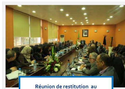
Réunion de restitution au Ministère de la Santé