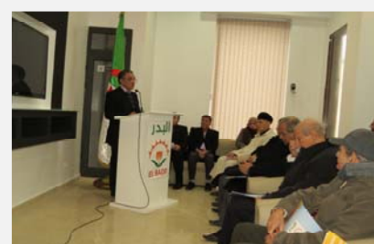
Le Président d'ELBADR remercie les donateurs

L'Association ELBADR d'aide aux malades atteints du cancer, a inauguré, le mercredi 04 février 2015, la maison d'accueil et de conseils baptisée «Dar El-IHSAN» au centre de la ville de Blida. (Lire page 3)