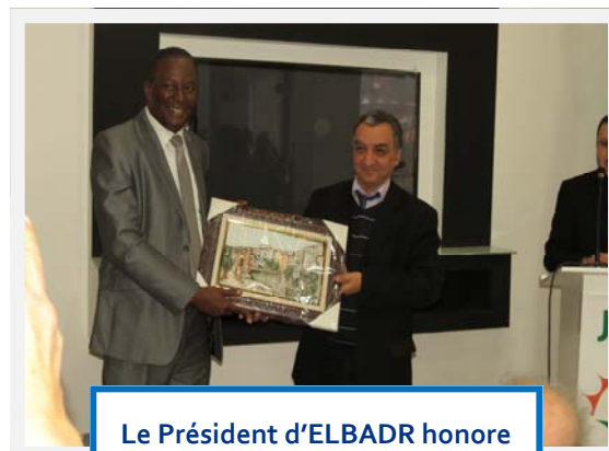
Le Président d'ELBADR honore le Représentant de l'OMS

Dar EL-IHSAN est un établissement d'accueil, d'hébergement et d'orientation des malades atteints de cancer. Le bâtiment compte 17 chambres, des espaces communs, un centre de remise en forme. Un staff de bénévoles assurent sa gestion.. Dar EL-IHSAN est accessible par train et par bus, elle est située en plein centre ville, à proximité des centres de soins. La wilaya de Blida est un pôle de soins important. Elle abrite le Centre Anti Cancer (CAC), Centre National qui accueille des malades des différentes wilayas du pays.