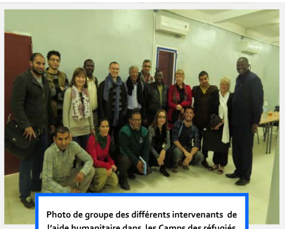
Photo de groupe des différents intervenants de l'aide humanitaire dans les Camps des réfugiés sahraouis- Tindouf -Algérie

Le Bureau de l'OMS est, déjà intervenu, par le passé, dans les Camps des réfugiés Sahraouis dans le cadre de la mise en œuvre d'un programme d'aide, financé par l'Union Européenne ( ECHO)