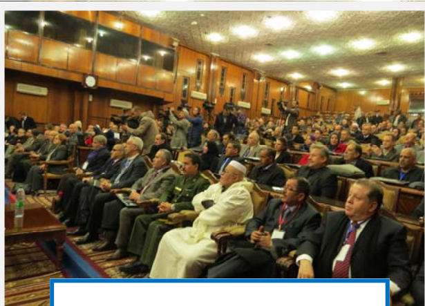
Rencontre des officiels avant l'inauguration

Dans son intervention, à la cérémonie d'ouverture, le Représentant de l'OMS le Dr. Bah Keita a exprimé sa satisfaction et a félicité les autorités sanitaires nationales pour l'engagement et la célérité dont ont fait preuve l'ensemble des partenaires et des experts pour l'élaboration du plan national de préparation et de riposte en cas de menaces sanitaires à potentiel épidémique et d'urgence de santé publique de portée internationale. Ce plan premier du genre dans la région africaine, est un exemple et une performance qui vient s'ajouter aux différents acquis de l'Algérie en matière de santé.