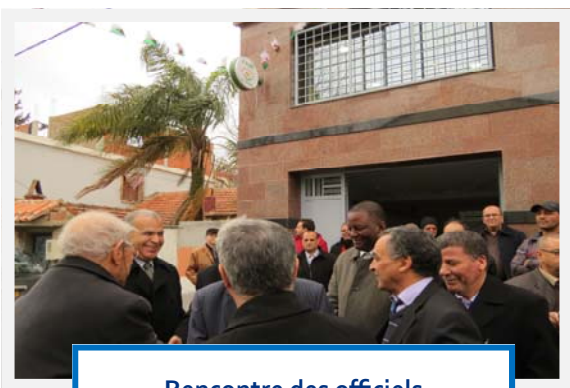
Rencontre des officiels avant l'inauguration