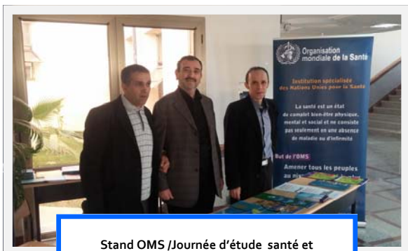
Stand OMS /Journée d'étude santé et environnement

Une documentation technique OMS a été exposée et distribuée, à l'exposition organisée, en marge, de l'évènement.