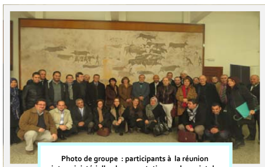
Photo de groupe : participants à la réunion interministérielle de concertation sur le projet de Plan National Santé Mentale 2015-2020

Pour consolider l'approche multisectorielle, cette réunion a été suivie de deux autres associant huit autres départements ministériels. Ce processus d'élaboration a également fait l'objet d'une mission d'appui technique de l'OMS, qu'elle en soit vivement remerciée.