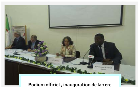
Podium officiel , inauguration de la 1ere Journée Nationale de l'IPA

Cette journée a été rehaussée par la présence du Ministre de la Santé, de la Population et de la Réforme Hospitalière, M. Abdelmalek Boudiaf qui a félicité la direction et le staff de l'IPA pour l'organisation de cette journée. Le Ministre de la Santé a informé l'assistance des directives et des nouvelles dispositions adoptées par son département pour l'amélioration de la prise en charge de la lutte contre le sida en Algérie et également celles concernant l'amélioration des capacités techniques et logistiques de l'Institut Pasteur d'Algérie en vue d'une meilleure organisation et d'efficacité dans sa réponse aux différents besoins et sollicitations des structures de santé et notamment en matière d'approvisionnement et de production de vaccins.