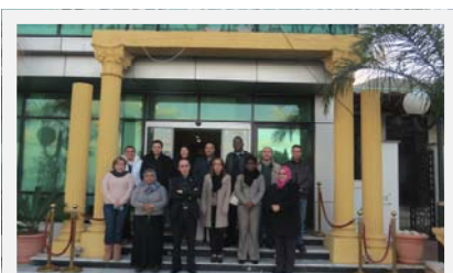
Equipe OMS Algérie