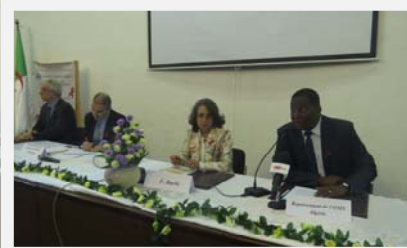
Séance inaugurale 1 ère journée Nationale de Pasteur

Le VIH/Sida a été au centre de la 1 ère journée Nationale de Pasteur tenue le 11 décembre 2014. Cette journée scientifique et technique sur le VIH /Sida a réuni l'ensemble des intervenants dans la lutte contre le VIH/Sida en Algérie ( suite page 3).