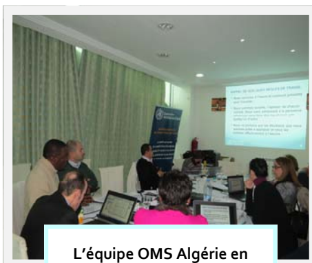
L'équipe OMS Algérie en séance de travail

Cette retraite, a parmi de procéder à l'évaluation à mi-terme de la mise en revue du plan de travail 2014-2015. La revue annuelle pour la période 2014, a été un exercice des plus probants. Elle a permis à l'équipe OMS Algérie, de proposer des actions d'ajustement vers l'atteinte des résultats escomptés dans le Plan de Travail 2014-2015.