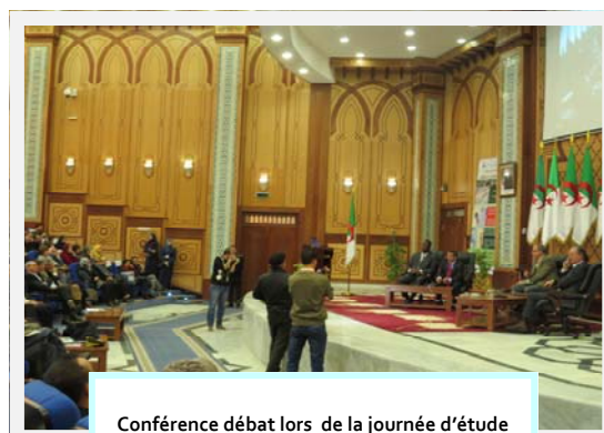
Conférence débat lors de la journée d'étude sur Ebola—Université de Médéa