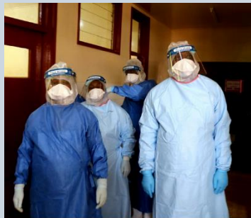
Le Premier Ministre conduit une visite de solidarité au premier cas confirmé de maladie à COVID-19