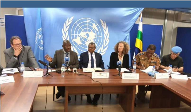
Conférence de presse conjointe Ministère de la Santé-OMS-MINUSCA