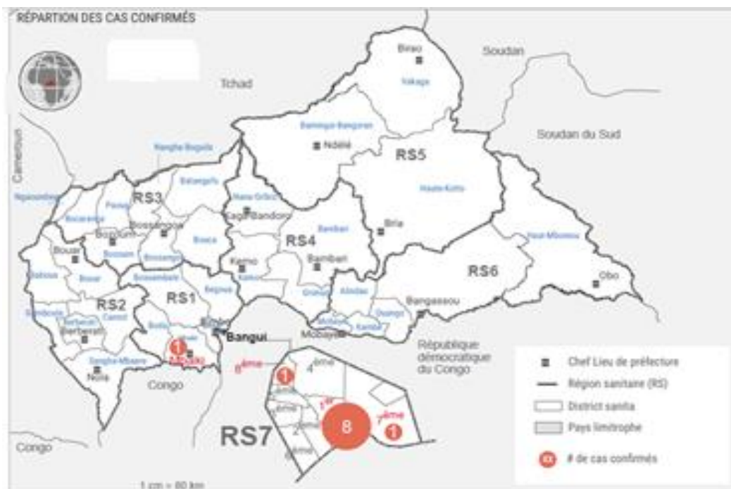
Carte : Distribution des cas confirmés de COVID-19 par districts (au 10 avril 2020), n=11

Un (01) des cas confirmés est résident de Mbaïki et dix (10) de la ville de Bangui dont un (01) dans le 8 ème arrondissement, huit (08) dans le 1 er arrondissement et un (01) dans le 7 ème arrondissement.