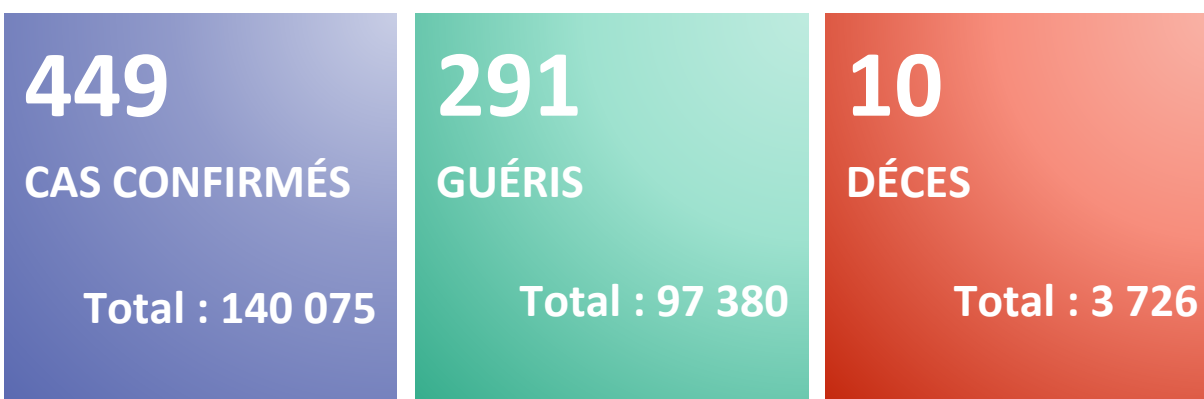
Figure 1 : Evolution du nombre quotidien de nouveaux cas confirmés et nouveaux décès par COVID-19 du 25 février 2020 au 01 juillet 2021 en Algérie

Rapport N° 461 Date du rapport : 02 juillet 2021 Date des Données : 01 juillet 2021